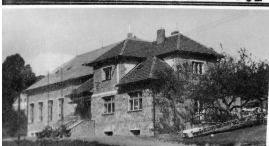
Pustá Kamenice 21.X.1962

Sportovní hřiště s umělým povrchem je od 1.5.2012 zpoplatněno. Cena kurtu na jednu hodinu činí 60,-Kč pro přespolní a 30,-Kč pro trvale žijící obyvatele a členy místních spolků (TJ a SDH). Děti do 15 let můžou na hřiště pouze v doprovodu osoby starší 18 let. Klíče od kurtu jsou k vyzvednutí po zaplacení poplatku u předsedy TJ Milana Sršně tel. 728 893 144 a hospodáře TJ Jaromíra Obrovského tel. 720 567 278.